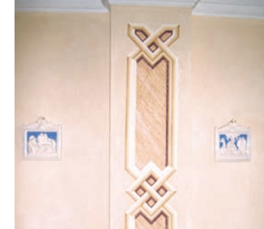
Elementi decorativi e pittorici ricostruiti sulla base delle tracce individuate nel corso dei restauri.